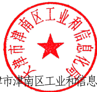
天津市津南区工业和信息化局